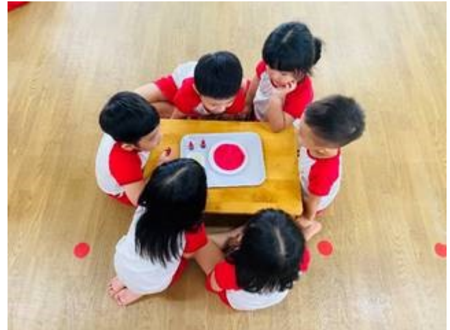
Thí nghiệm – Lớp 3-4 tuổi