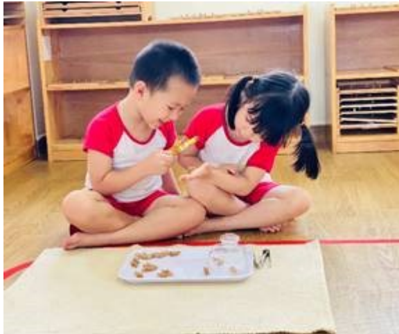
Bé quan sát ve sấu – Lớp 4-5 tuổi