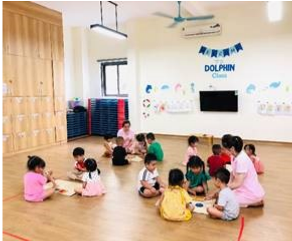
Giờ thực hành Montessori – Lớp 2-3 tuổi