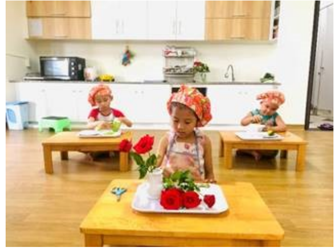
Bé cắm hoa – Lớp 4-5 tuổi

Flower arrangement practice – 4-5 yrs old