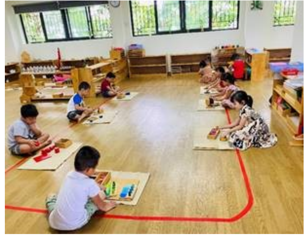
Giờ thực hành Montessori – Lớp 5-6 tuổi Montessori activities – 5-6 yrs old

- Photos: Các hình ảnh gốc về hoạt động của trẻ có thể được tìm thấy tại đường link sau đây/ Please see the photos as the below: