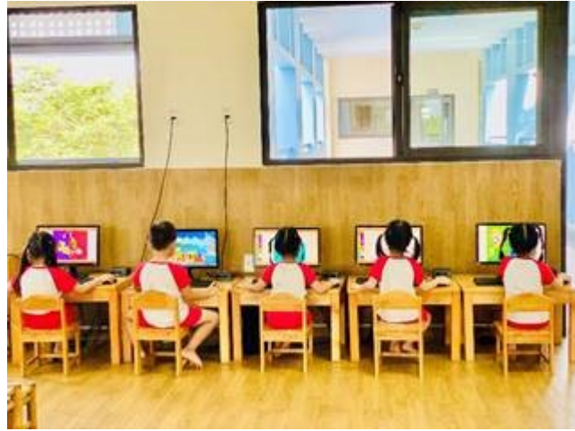
Bé làm quen với máy tính – Lớp 5-6 tuổi