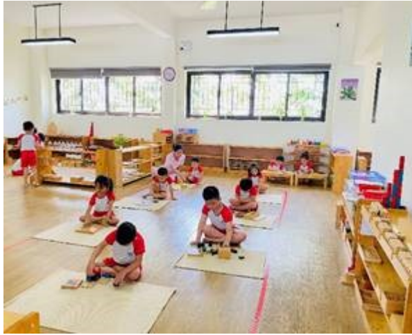
Giờ thực hành Montessori – Lớp 4-5 tuổi Montessori activities – 4-5 yrs old