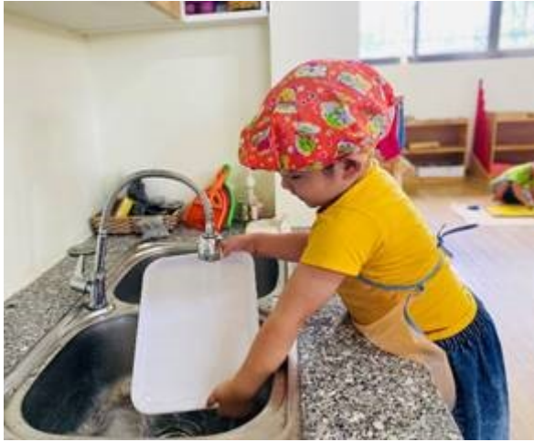
Bé thực hành rửa bát – Lớp 3-4 tuổi