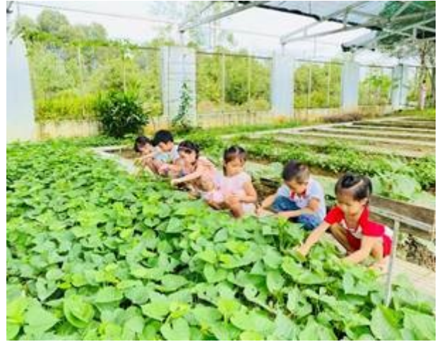
Thu hoạch rau – Lớp 5-6 tuổi