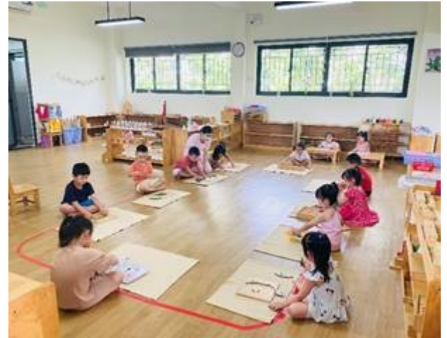
Giờ thực hành Montessori – Lớp 3-4 tuổi